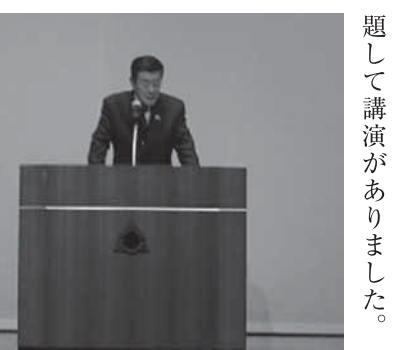
題して講演がありました。

ください。プールの窓口でも申請できます。 ●申込、問い合わせ先 電話 073-488-5808 FAX 073-488-5808 メール 0404021@pref.wakayama.lg.jp 〒641-0014 和歌山市毛見1437の218(県子ども・女性・障害者相談センター)